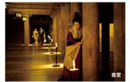
翔姫が人型の紙の人形と遭遇し戦うシーン。