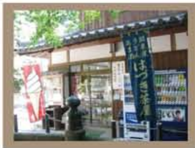
はづき茶屋 (摩尼殿前)

シンプルなメニューですがうどんもよくダシがきいていて、おでんもよく味がしみていて…ふんわり握ったおにぎりが山登りでベコベコのお腹を満たします。ここで数々の制作者が召し上がりました。