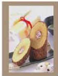
杵屋創作西洋菓子 『書写 千年杉』

ラストサムライ撮影後、トム・クルーズがお土産に買って帰った和菓子。境内にある樹齢約700年の巨大スギをモチーフにした見た目もインパクトのある一品。お土産にぜひどうぞ。