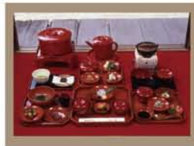
壽量院・精進料理

「圓教寺行事記」中に記された献立を現代風にアレンジされていて幻の書写塗りの器に盛り付けられています。美しい空気とともに五感で味わってください。