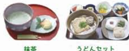
抹茶 うどんセット