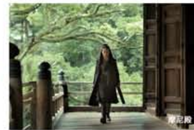
道姑 (女道士) と隠娘が会話するシーン。

巨匠ホウ・シャオシェン監督による「黒衣の刺客」の撮影が境内にて1週間行われました。監督の8年ぶりの最新作で、日本をはじめ台湾・中国で5年をかけ撮影されました。三つの堂で行われたアクションシーンは必見。