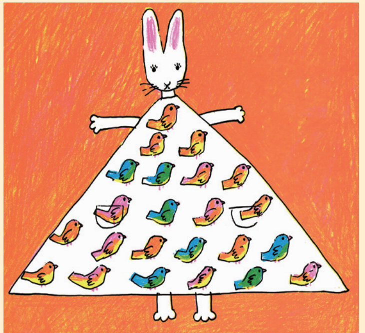
「わたしのワンピース」1969年 ©西巻茅子/こくま社