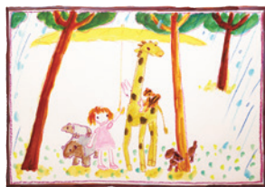
「ちいさなきいろいかさ」（金の星社）1971年

本展では、豊かな色彩とリトグラフ・水彩・刺しゅうなどの多彩な手法で描かれた作品の数々やラフスケッチを展示し、あたたかくのびやかな絵本の世界へいざないます。心の原点に触れるような作家のイマジネーションをぜひお楽しみください。