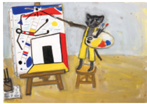
「えのすきなねこさん」（童心社）1986年