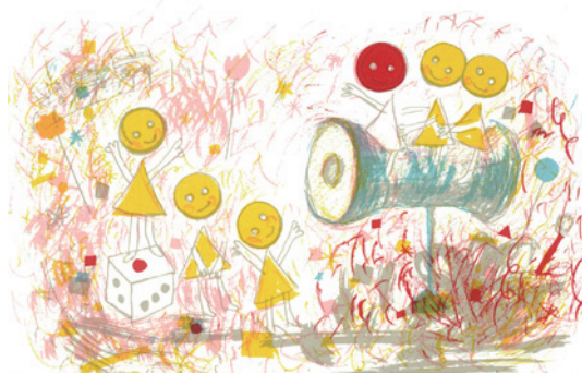
「ボタンのくに」（こぐま社）1967年