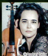
アレナ・バーエフ(Vn)