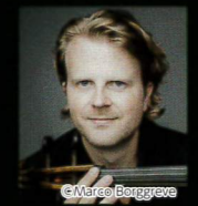
ユリアン・シュテッケル(Vc)