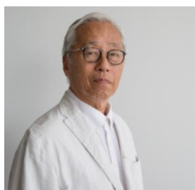
▲令和4年度 招聘作家 杉本博司氏 (ビデオ出演)