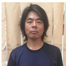
▲令和3年度 招聘作家 日比野克彦氏