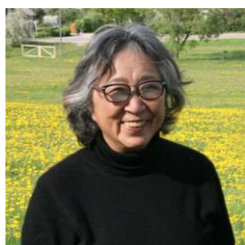
▲令和4-6年度 招聘作家 中谷芙二子氏 (ビデオ出演)