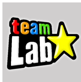
▲令和5年度 招聘作家 チームラボ