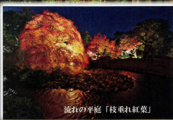
流れの平庭「枝垂れ紅葉」