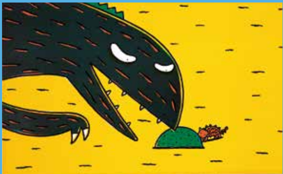
『おまえ うまさうだな』(2003年 ポプラ社)