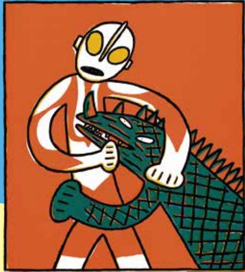
『おとうさんはウルトラマン』(1996年 学研プラス)